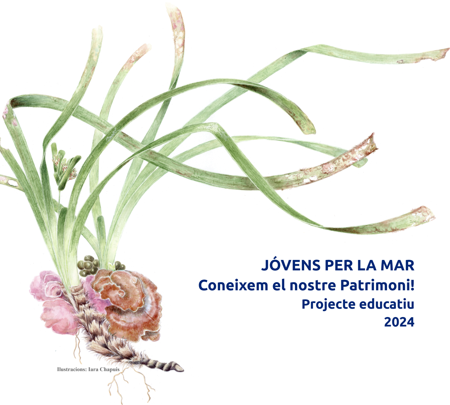
Il·lustracions: Iara Chapuis